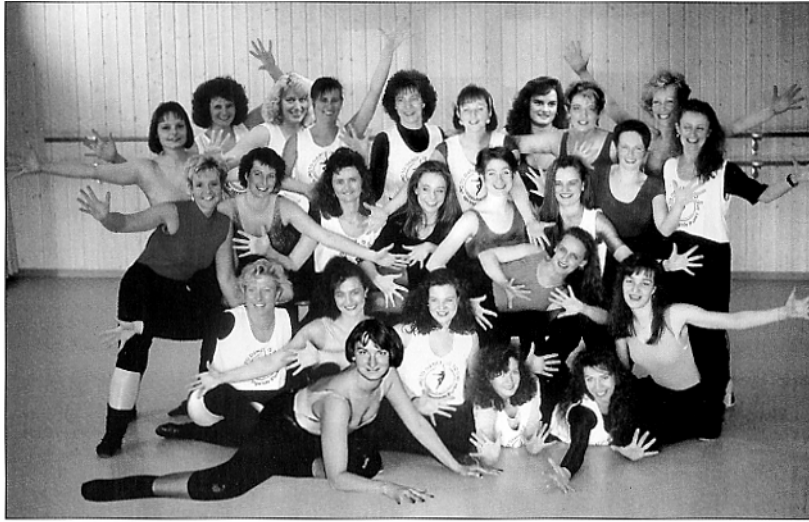
Tanzgruppe „Der Springende Punkt“ VAMPIRE